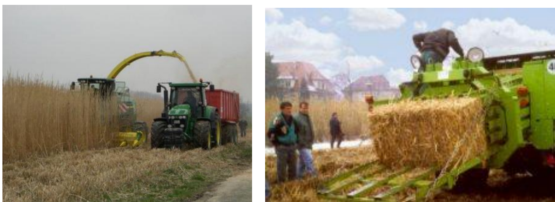
Рис. 3.4 Збирання та пресування соломи.

Від 5 до 20 року використання – 20 т/га.