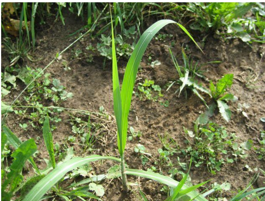
Рис. 3.2 Сходи міскантуса через 5 тижнів після садіння

Визначали вплив розміру різомів, які висаджували, й терміну закладання плантації (весняний, зимовий) на відростання рослин. Спостерігали майже стовідсоткове відростання рослин із великих кореневищ (довжина різом близько 10-15 см). Менші саджанці дали гірші результати.