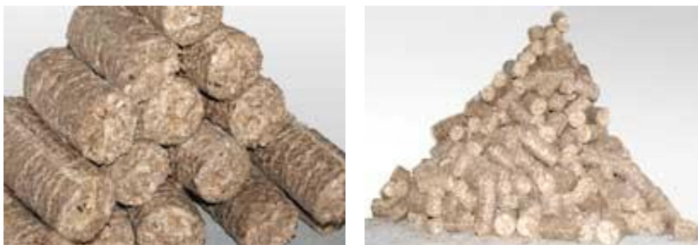
Рис. 3.5 Переробка соломи міскантуса в брикети.