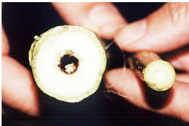
Рис. 7.2 Поперечний розріз стебла мальви пенсільванської (з ліва) та верби (з права).

Збирають урожай сухої маси з грудня по березень. А за сухої погоди збирати біомасу можна аж до квітня, але до того як рослини знову пустять пагони. Збирання у зимову суху погоду дозволяє обходитися без додаткового дорогого сушіння за використання біомаси на спалювання. Вологість біомаси мальви за зимових жнив коливається в межах 23%, тоді як вологість, наприклад, верби коливається в межах 50%. Така вологість є оптимальною для пресування біомаси в брикети. Річна продуктивність мальви пенсільванської, з хорошими параметрами як палива, значно більша, ніж швидкорослих деревних порід, наприклад, верби (рис 5). Таке виробництво брикет є енергетично та економічно ефективним. Суха маса збирається спеціальними машинами та легко подрібнюється одразу на полі і перевозиться на заводи, де пресується у брикети. Витрата на виробництво таких брикет становить 25 EUR/т.