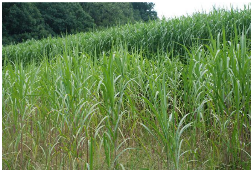
Рис. 3.3 Однорічні посадки міскантуса

З огляду на багаторічний характер плантації можна використовувати органічне добриво. Максимальна доза – 30 т/га, що відповідає 180 кг азоту, 75 кг фосфору, 150 кг калію і 30 кг магнію. Ця доза практично може замінити мінеральні добрива.