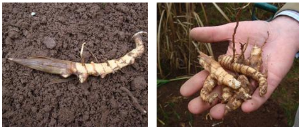
Рис. 3.1 Садивний матеріал Miscanthus giganteus (частини кореневищ).

Розмноження саджанцями, отриманими через поділ кореневищ. У 1990 році на дослідній станції в Данії зауважили, що за спроби усунути плантацію M. giganteus із застосуванням ґрунтообробних машин, отримано зворотний результат і швидке відростання рослин. Це стало підставою нового методу закладання плантацій.