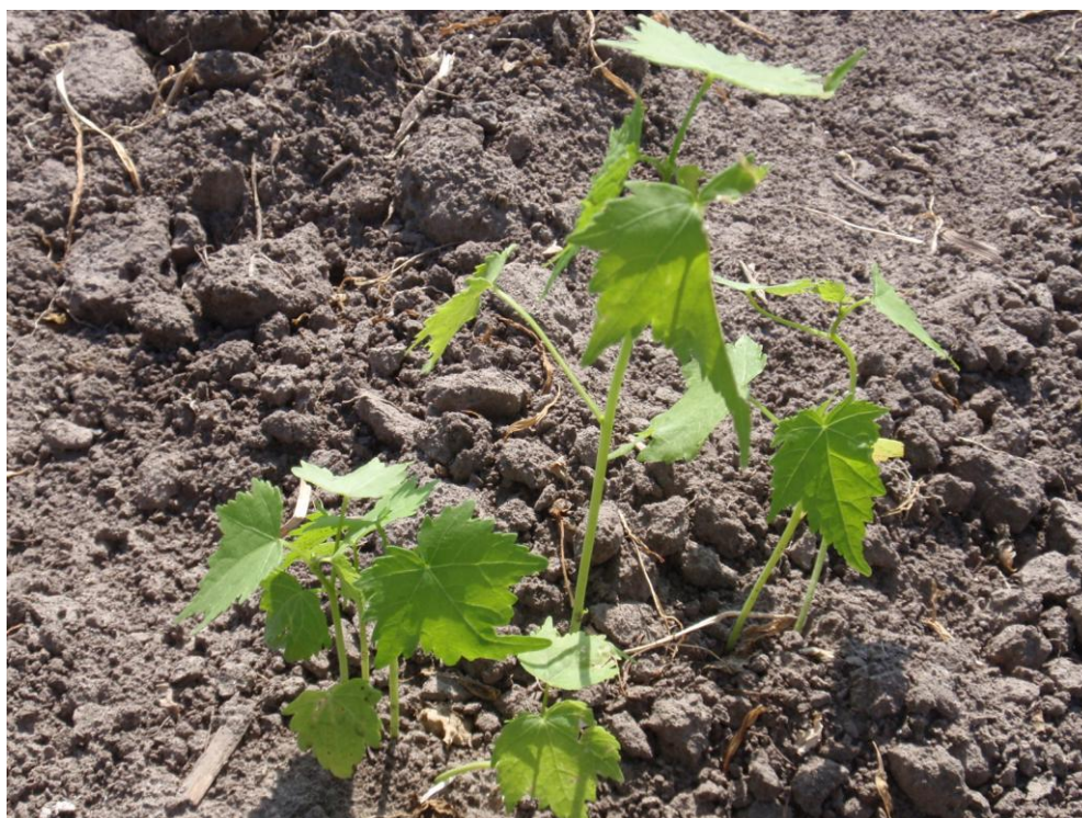
Рис. 7.1 Сходи мальви пенсільванської

Після збирання врожаю проводиться останній міжрядний обробіток на глибину 6-8 см. Його необхідно поєднати з внесенням у ґрунт фосфорно-калійних добрив у дозі 60-90 кг/га.