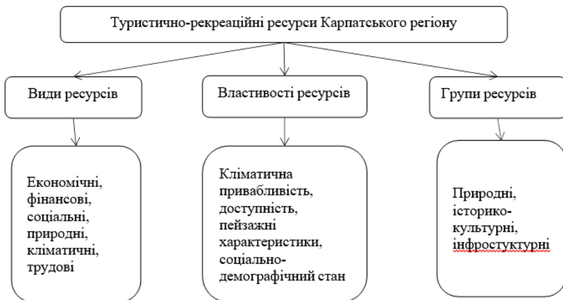
Рис.2.1. Туристично-рекреаційні ресурси розвитку гірськолижного туризму Карпатського регіону

Усі вищезазначені фактори підкреслюють значний туристичний потенціал та можливість економічного розвитку Карпатського регіону. Стратегічним завданням розвитку туризму в Україні, зокрема в Карпатському регіоні, є створення конкурентоспроможного національного туристичного продукту як для внутрішнього, так і для світового ринків. Це й розширення внутрішнього туризму, збільшення в'їзного туризму, сприяння комплексному розвитку курортних територій з урахуванням соціально-економічних інтересів населення, а також збереження та відновлення природних ландшафтів та історико-культурної спадщини. Відповідно до принципів сталого та збалансованого розвитку конкурентна політика стає рушійною силою економічного зростання [30, с.165]. Опис туристично-рекреаційних ресурсів Карпатського регіону наведено на рисунку 2.1.