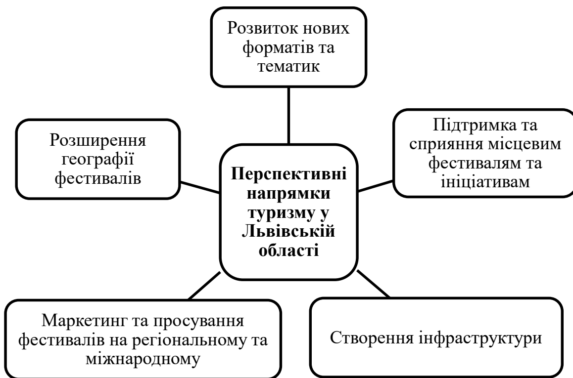
Рисунок 3.1. Перспективні напрями розвитку фестивального туризму у Львівській області

проведення фестивалю або міста повітряним, автомобільним або залізничним транспортом; трансфер (аеропорт/вокзал – готель/кемпінг – аеропорт/вокзал).