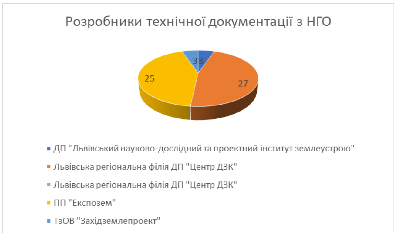
Рисунок 2 – Розробники технічної документації

Львівська регіональна філія ДП "Центр ДЗК"-27, ПП "Експозем"-25, ТзОВ "Західземлепроект"-3, рисунок 2.