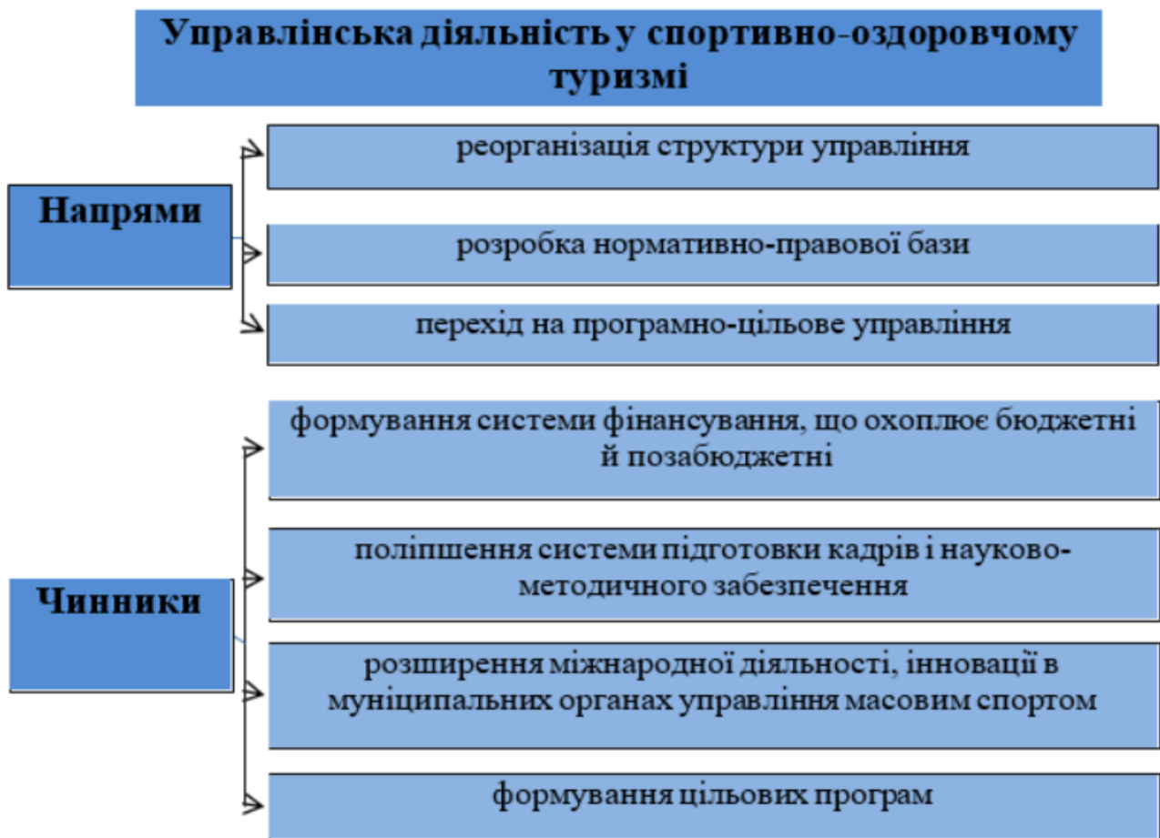
Рис. 1.2. Основні напрями в управлінні спортивно-оздоровчою діяльністю та чинники впливу на неї

Ці принципи служать основою для управління спортивно-оздоровчою діяльністю, забезпечуючи структурований підхід до зміцнення здоров'я, залучення та добробуту громади. На Рис. 1.2. наведено основні напрямки управління та фактори, що впливають на спортивну та оздоровчу діяльність, наголошуючи на стратегічному плануванні, необхідному для дотримання цих принципів і вирішення пов'язаних із ними проблем.