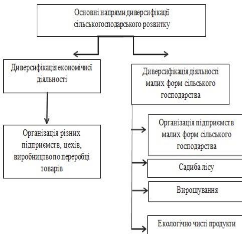
Рис. 2. Основні напрями диверсифікації сільськогосподарського виробництва [12].

О. Виханський говорить про диверсифікацію сільського господарства як метод розвитку, який використовується, якщо аграрна галузь не може прогресувати на певному ринку [5]. На рис. 2.1. показано, як можуть розвиватися наступні напрямки диверсифікації сільського виробництва.